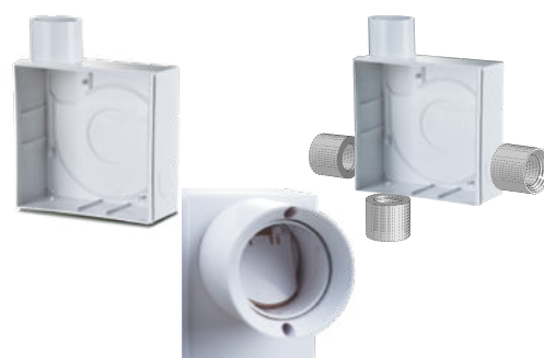
grawitacyjny zawór zwrotny

Obudowa podtynkowa powinna zostać zamontowana w ścianie na etapie prac ogólnobudowlanych i połączona z głównym pionem wentylacyjnym za pomocą przewodu elastycznego. Obudowa posiada otwór z dławikiem dla wyprowadzenia przyłącza elektrycznego. Front obudowy jest przykryty kartonową płytą zabezpieczającą przed uszkodzeniami i zabrudzeniami w trakcie robót budowlanych. Po zakończeniu prac wykończeniowych należy zdjąć osłonę kartonową i zainstalować wentylator w obudowie.